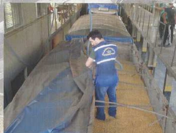
Retirada de amostras para a Classificação.